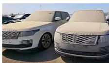
אשדוד: ויטו רכבי שטח שלא נמכרו ב