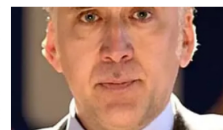
כוכבי סרטים שהתרוששו ועכשיו עובדים