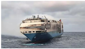
סוף לפליסטיי אייס: האונייה שנשרפה כשעליה 4,000 מכוניות גרמניות - טבעה | ככלכליסט