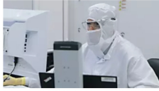
לא מוסחים על אף שבב: הטאץ הישראלי שמניע את העשיית השבבים ...