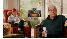
עדיין מחלכטים? הגיע הזמן שתתנסו! 60 ימי התנסות במחיר מיוחד