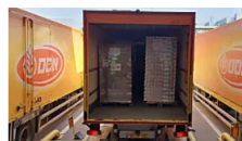
אסם נסטלה במבצע ענק: משגרת סיוע חירום לקהילה היהודית באוקראינה