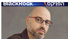
ענקית ההשקעות העולמית בלאקרוק מגיעה לארץ והמשקיעים מסתערים ע...