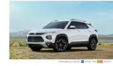
הרכב שנמצא בראש טבלת המכירות בארד"ב מגיע לכבוש את ישראל!