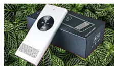
כולם משתגעים על מכשיר התרגום