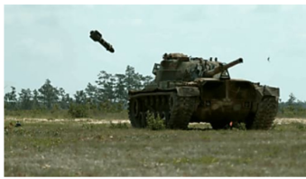
הקברניט: איך עובד טיל נגד טנקים? | ככלכליסט