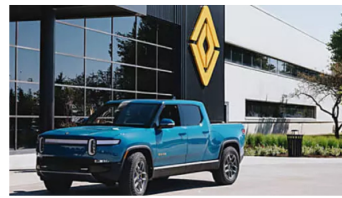
זיגוג המחירים של ריוויאן האיץ את צניחת המניה | ככלכליסט