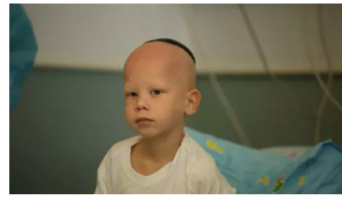
יא אפשר שלא לכבות: היכל נחלם על החיים, המשפחה קרה כלכלית. כך חונכו לעזור