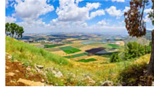
289 אלף שי"ח לקרקע בשכונת נוף כנרת היוקרתית - "גם המחיר עוצר נשימה"