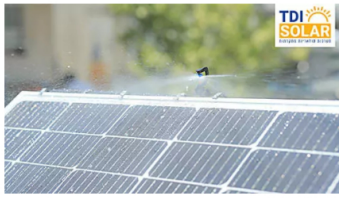
TDI SOLAR - לתקדם לדור הבא של המערכות הסולאריות