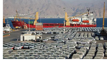
25 אלף מכוניות חדשות נמסרו בפברואר; יונדאי מובילה עם 12.6 אלף מסירות | ככלכליסט