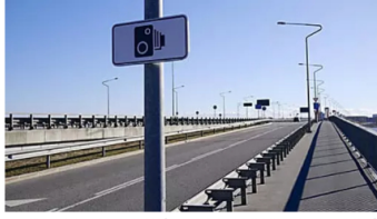
לקראת אגרת הגודש: שיטה חדשה למדידת מהירות בנתיבי איילון | ככלכליסט