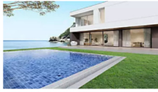
בעשירית ממחיר דירה בבריפריה: וילה בקפריסין חימכר לבעלי הון עצמי ש...