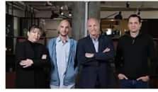
כך חשקיעו בחברה שהקים מפקד יחידת הסייבר של צה"ל